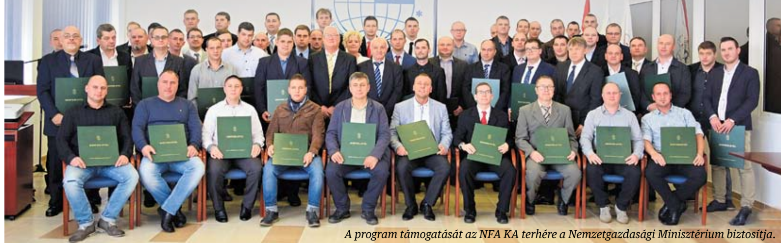
A program támogatását az NFA KA terhére a Nemzetgazdasági Minisztérium biztosítja.