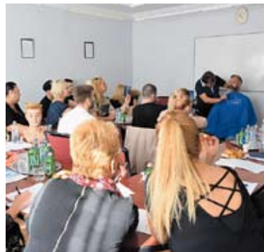
FODRÁSZ MESTER SZAKMAI TAGOZAT