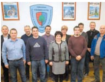
ÉPÍTÉSZ MESTER SZAKMAI TAGOZAT