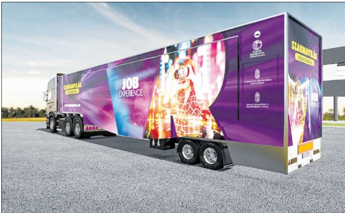
A Szabolcs-Szatmár-Bereg Megyei Kereskedelmi és Iparkamara (SZSZBMKIK) szervezésében 2019. március 25-27 között három napon, három helyszínen, közel hatszáz gyereket fogad a kamarai pályaaorientációs munkát támogató „Szaknavilág” országos kamionos road show. A meghívott hatodik-hetedik osztályos diákok VR-szemüvegeken keresztül négy különböző szakmacsoportban próbálhatják ki magukat Kisvárdán, Mátészalkán és Tiszaújlak településeken.

A szülők támogatását, érzékenyítését is fontos szempontként kezeli a kamara, hiszen az együtt gondolkodás a pályaválasztás előtt álló diákokért nemcsak egyéni, szülői és tanári felelősség, hanem a támogató, közreműködő szervezeteken is múlik. A megyei kamara, a pályaaorientáció keretében évek óta biztosít az általános iskolásoknak cég és üzemlátogatásokat, osztályfőnöki órákat, és szülői értekez-